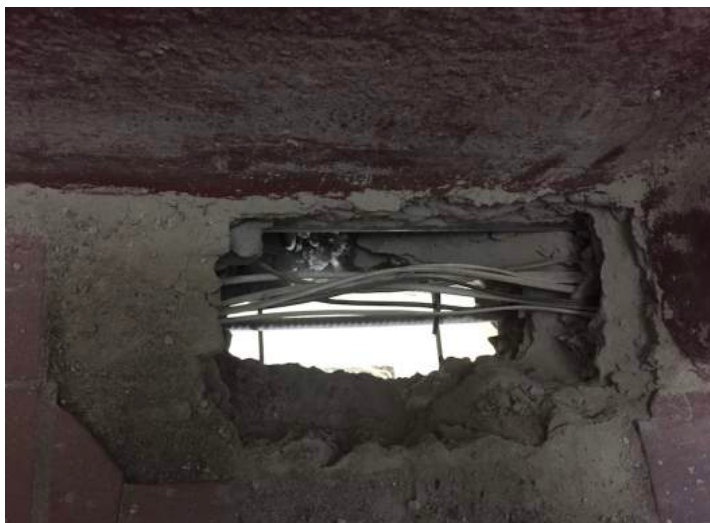
5 подъезд, 3-й этаж, справа от кв. 124. Фото от 25 июля 2017 входило в состав первичного обращения.

Рядом с квартирой 124 было сделано отверстие в перекрытии. На фото вы можете видеть кабели, которые проходили в канале в полу. Канал разрушен, в отверстие вставлены гильзы и все залито бетоном. Теперь по старому кабель-каналу невозможно протянуть ни новый кабель, ни обслуживать старый. Назначение кабелей в полу подрядчикам неизвестно. Залить бетоном не означает устранить нарушение.