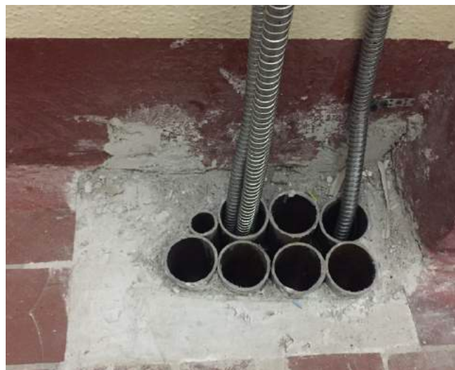
Тоже самое место 22 сентября 2017, кабели в полу залиты бетоном. Сейчас вокруг новой проводки выстроен шкаф.

Бетонные пятна и пятна краски никуда не исчезли и видны на фотографиях от 13 ноября, которые я привожу ниже. Рядом с подъездами 2, 4, 5, 6 и в арке. Испачканный асфальт не является большой проблемой, которая сильно мешает жить, но это не позволят вам утверждать, что он не испачкан.