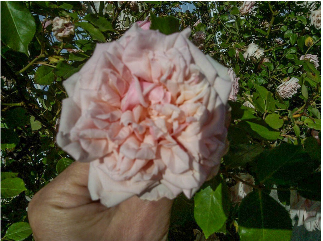
Août 2016 • August 2016