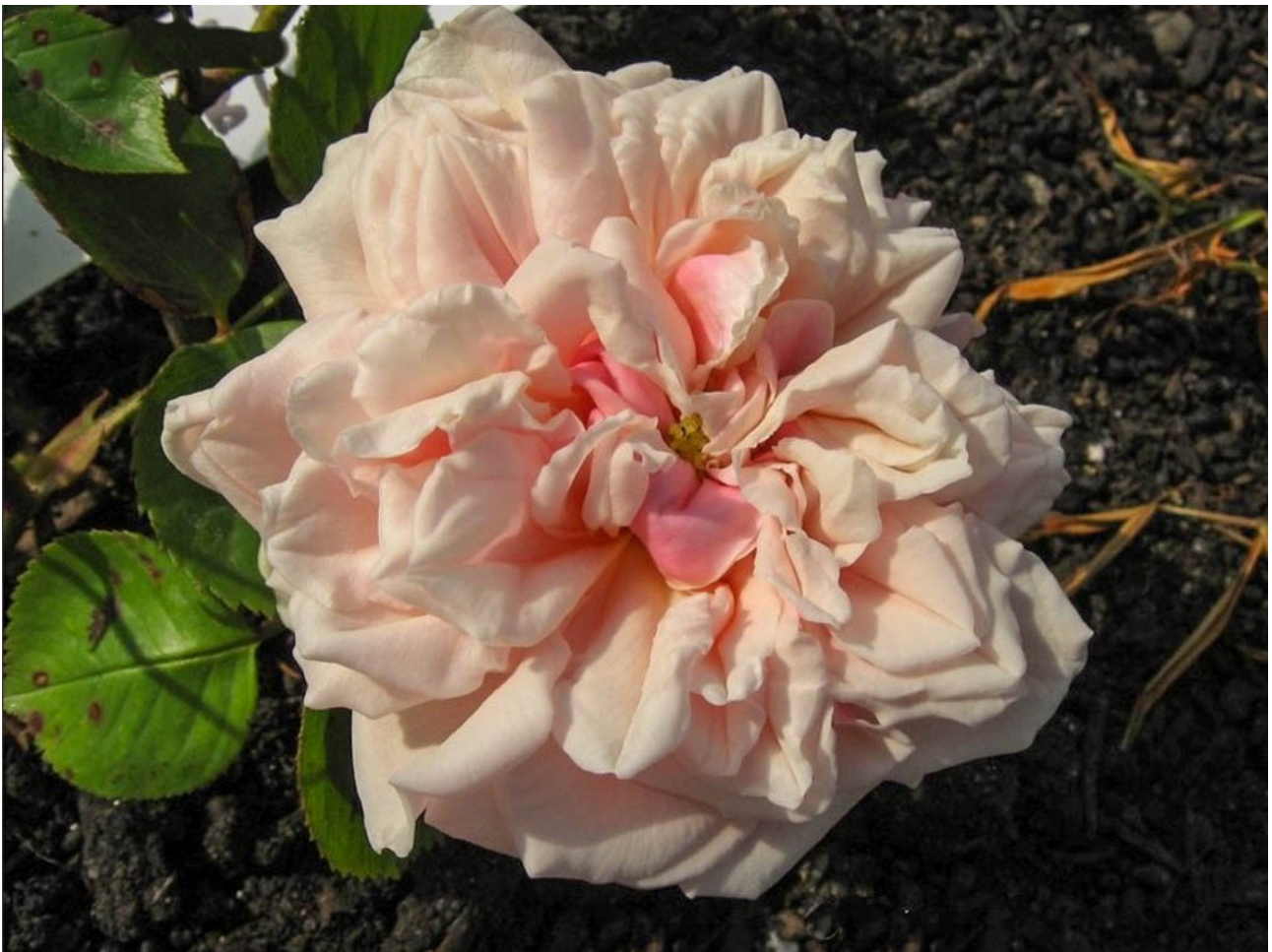
'Fürstin -Bismarck', Foto Etienne Bouret, AmisRoses

(Falsch als 'Fürst Bismarck' bezeichnet • Wrongly labelled 'Fürst Bismarck' • Faussement appelé 'Fürst Bismarck')