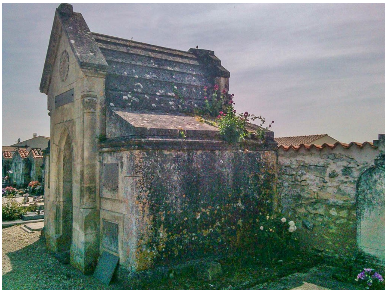
Une chose minuscule cachée dans l'ombre de la chapelle de pierres. Inhumation en 1905. Ein winziges Etwas, das im Schatten der Steinkapelle verborgen ist. Beisetzungen 1905. A tiny thing hidden in the shadow of the stone chapel. Burials of 1905.

J'ai pensé qu'il serait souhaitable de faire greffer la plante afin de lui donner de la vigueur et voir ce qu'elle donnerai. Moi qui ai un faible pour les roses blanches, je ne saurai me passer de celle ci.