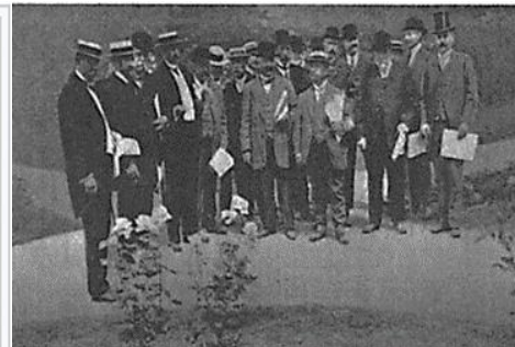
(Photo on the right) The jury at the large Parisian rose exhibition (Bagatelle in 1911) attributing the Jonkheer J.L. Mock rose the Great Gold Medal of the City of Paris.

*Jonkheer J. L. Mock. (Illustrated above.) An imposing Rose, of magnificent size, with petals of exceedingly heavy substance, delicately reflexed, showing light, creamy pink against a background of brilliant deep carmine. At its best in hottest weather, because its great petalage requires heat to develop and open properly. The color fades slightly, and its delicate perfume is quite fleeting. The flower-stems are notably erect and stiff. It grows tall, but is not bushy. The foliage is subject to black-spot and is likely to be lost early unless protected against it. The plant is quite hardy, but not a profuse bloomer. In spite of its faults, deserves a place in every garden. Bagatelle Gold Medal. $1 each.