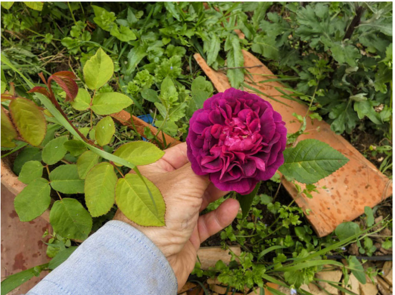
Arrivé au jardin en août 2022. Première belle fleur le 15 mai 23. Kam im August 2022 in den Garten. Erste schöne Blüte am 15. Mai 23.